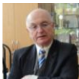
Эдуардас Габнис (Литва) председатель комиссии

профессор Литовской академии музыки и театра (ректор 2005-2011), эксперт в области высшего музыкального образования, администрирования учебных заведений музыкального образования